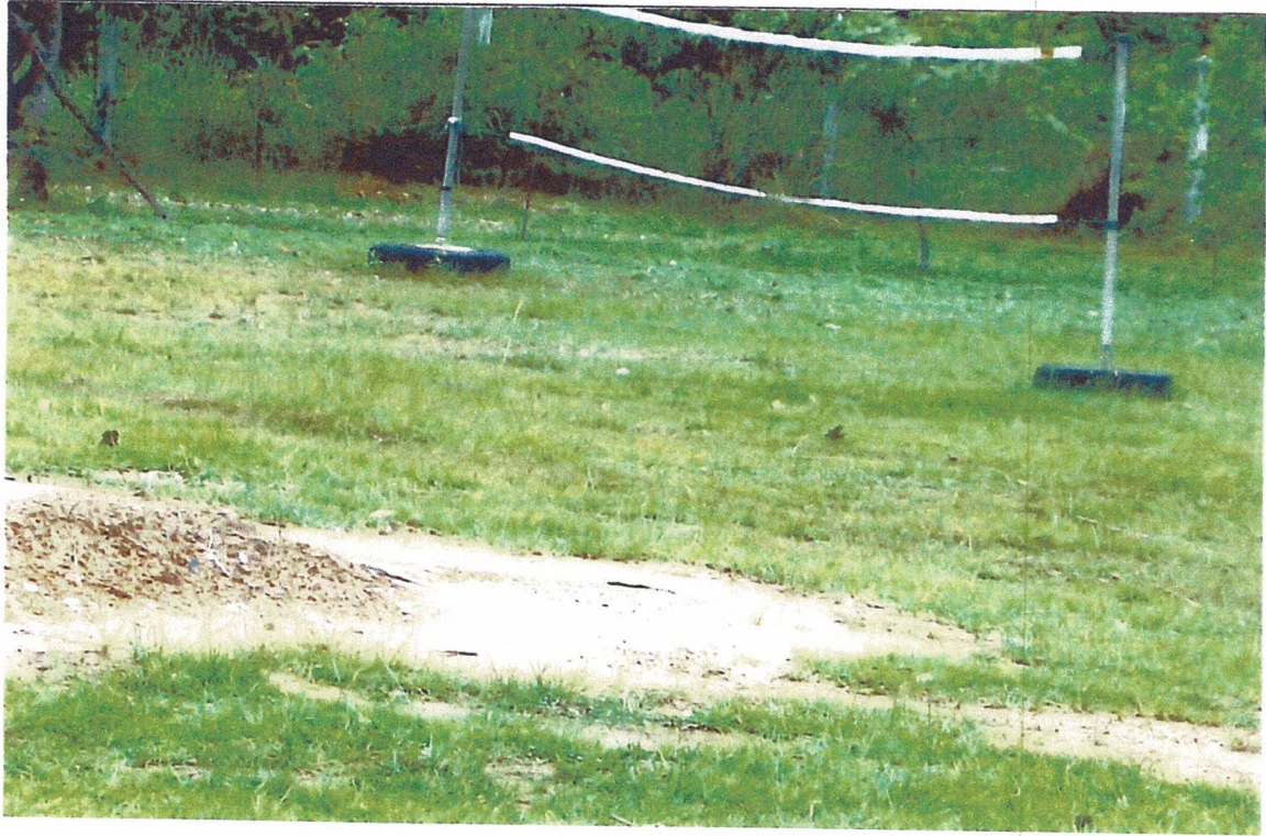
๔. สนามกีฬาบ้านดอนวิเวก